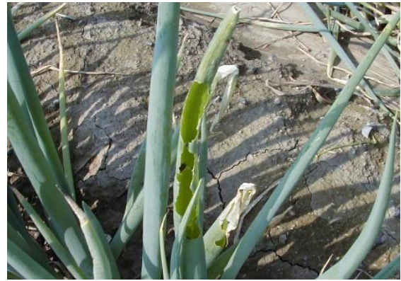
写真2 シロイチモジヨトウによる 被害葉