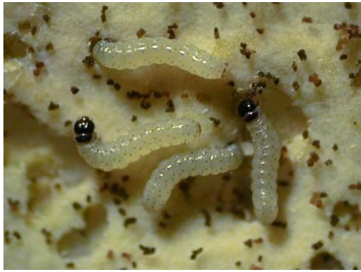
写真1 シロイチモジヨトウ若齢幼虫 (体長約2mm)