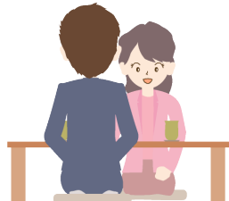
ご紹介後、相談員は退席いたします