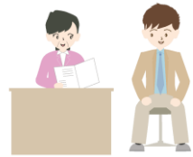
結婚相談会に参加