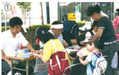
写真1：各地区にてふれあい祭り 写真2：行政主催の「環境フェスタ」に直売所が出店

JAさいかつでは、いつもご利用いただいている地域の皆様との交流を図るため、様々な企画を行っています。